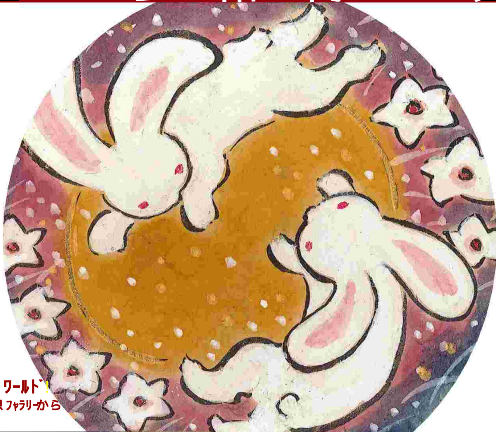
草笛ワールド 幻想ファミリーから