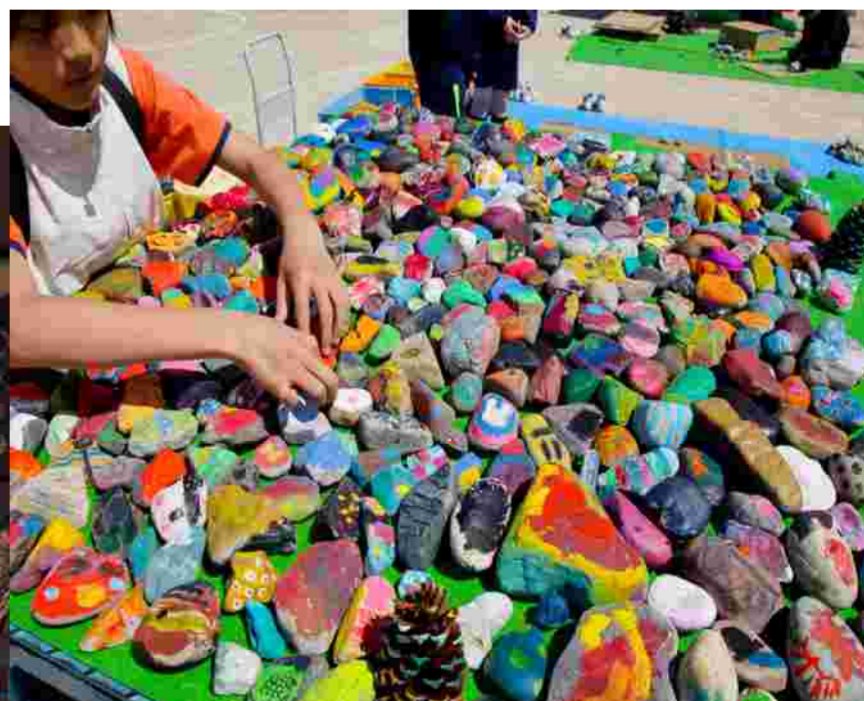
アート(モファ)で遊ぼう！