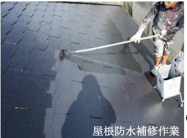
屋根防水補修作業

水に関するトラブルは本当に多く、水漏れ・湿気で建物は急速に衰えます。これらの定期的な点検や、適切な外部防水の修繕や改善を行うことで家の寿命は格段に延ばせます。もしも高所や範囲が広いため、自分達では無理なときは親しい大工さんや工務店に気軽に相談をされれば如何でしょうか。